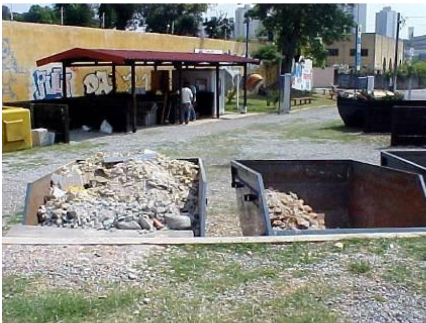
Figura 5. Ponto de Entrega Voluntária (PEV) que integra a função de concentração de cargas para a coleta seletiva