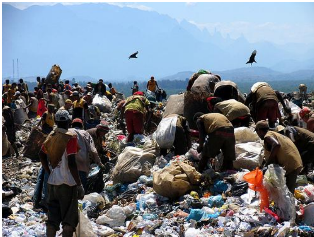
Figura 2. Encerramento de Lixão: oferta de alternativas a catadores

Os impactos ambientais negativos causados pela disposição dos resíduos domiciliares em lixões são diversos: comprometimento das águas subterrâneas e superficiais situadas na área de influência dos depósitos de lixo a céu aberto, atração de vetores e poluição do ar. A complexidade destes impactos depende da quantidade de resíduos, das características do solo, da topografia e geologia do local onde os resíduos são depositados e de seu entorno.