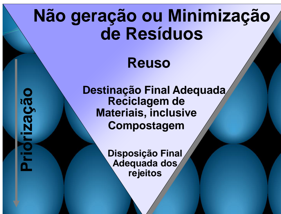
Figura 1 – Hierarquização no manejo dos Resíduos Sólidos Urbanos – Lei 12.305/2010